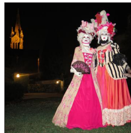
Assorties, avec leurs costumes style Marie-Antoinette avec perruque blanche, engageantes, échelles de nués et chapeaux à plumes, ces deux dames vont déambuler ainsi pendant trois après-midi entre les canaux vénitiens.