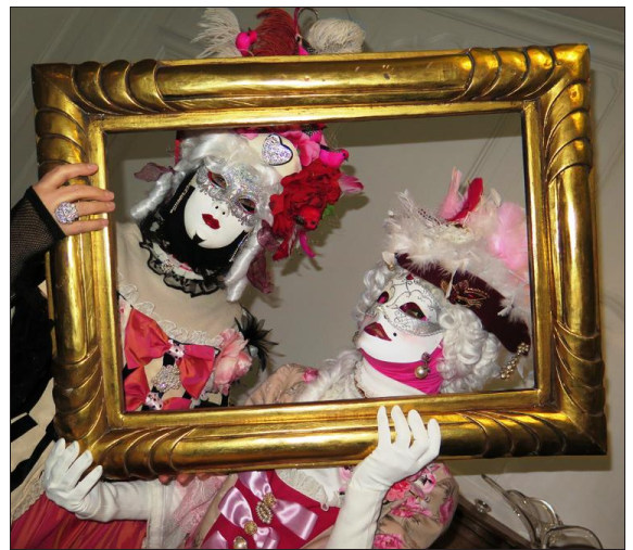
Derrière ces costumes somptueux se cachent deux passionnées d'histoire, membres actives de l'association locale La Tour prend garde, parties faire le carnaval de Venise qui ouvre aujourd'hui.