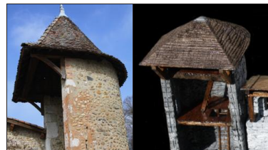
Fausse tours dites "ouvertes de gueules". Le modèle de ce type de défense, existe à quelques kilomètres avec les tours de l'entrée du château de Virieu qui ont servi de modèle.