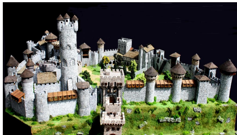
jusque-là, La Tour-du-Pin était réputée pour ses deux triptyques. Désormais, elle le sera également pour la reconstitution de son château médiéval, dont le périmètre s'établissait à 640 mètres, à l'emplacement du cimetière et du parking actuels.