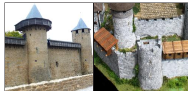
Les hourds étaient des galeries de défense en bois, édifiés sur les créneaux de remparts ou de tours, démontables en temps de paix. Cette solution était plus économique que l'édification de mâchicolis en pierre pour la même fonction. Ce sont les hourds de Carcassonne qui ont servi de référence pour la maquette.