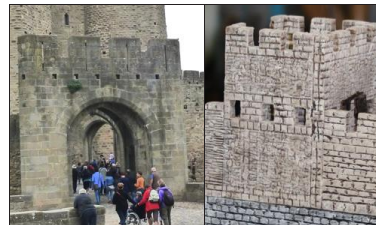
Pour les défenses avancées des portes d'accès, la barbacane, l'inspiration a été prise sur l'entrée principale de la citadelle de Carcassonne.